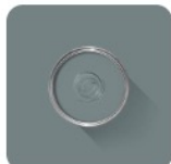
De Nimes No. 299