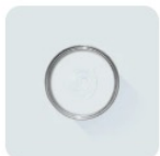
Sizing No. 314