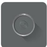
Down Pipe No. 26